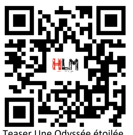
Teaser Une Odyssée étoilée

Ne manquez pas cette opportunité unique de vivre une aventure magique et éducative, où les étoiles elles-mêmes vous guident à travers les merveilles de notre monde. "Une Odyssée Étoilée" est bien plus qu'un spectacle, c'est une invitation à rêver et à découvrir les trésors cachés de notre humanité.