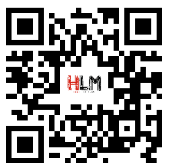
Teaser Une Odyssée étoilée

Ne manquez pas cette opportunité unique de vivre une aventure magique et éducative, où les étoiles elles-mêmes vous guident à travers les merveilles de notre monde. "Une Odyssée Étoilée" est bien plus qu'un spectacle, c'est une invitation à rêver et à découvrir les trésors cachés de notre humanité.